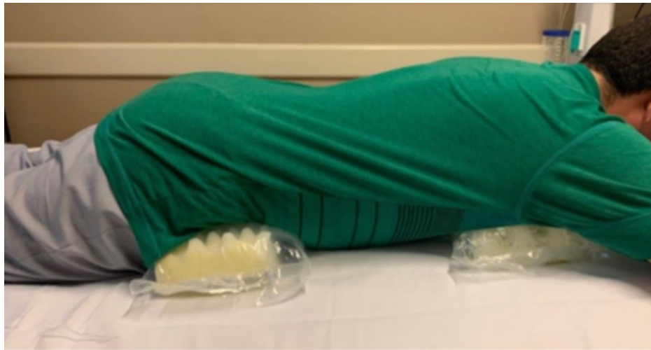
Figura 1. Posición de Trendelenburg inversa durante la pronación. Bertoia et al. (2019)

Está plenamente demostrado que la pronación no implica una contraindicación a la nutrición enteral, en líneas generales es muy bien tolerada y se considera factible, segura y efectiva (Patel et al., 2020). Algunos investigadores sugieren iniciar con dosis tróficas y otros prefieren iniciar con una infusión más completa, realmente esta decisión depende en gran medida del estado hemodinámico del paciente y de su tolerancia gastrointestinal. Con el fin de mejorar la tolerancia alimentaria, el vaciamiento gástrico y disminuir el reflujo gastroesofágico, el paciente debe ser colocado en la posición de Trendelenburg inversa con una elevación del tórax de aproximadamente 10-25°, (Figura 1) esto contribuye a reducir el riesgo de aspiración, edema facial e hipertensión intraabdominal, así también el uso de procinéticos resulta de gran ayuda para favorecer la tolerancia gastrointestinal (Bermúdez et al., 2020; Martindale et al., 2020; Matos et al., 2021). Sin embargo, al sumar otras condiciones como la sedación, sepsis, tratamiento con fármacos vasoactivos, bloqueadores neuromusculares e hiperglucemia (Behrens et al., 2021; Bermúdez et al., 2020), se propone avanzar a NP total o complementaria, procurando mantener una NE trófica (Álvarez et al., 2020; Bermúdez et al., 2020).