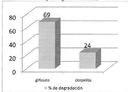
Grafica 2: Porcentaje de degradación obtenido